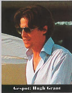
Gespot: Hugh Grant