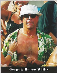
Gespot: Bruce Willis