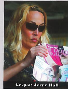
Gespot: Jerry Hall