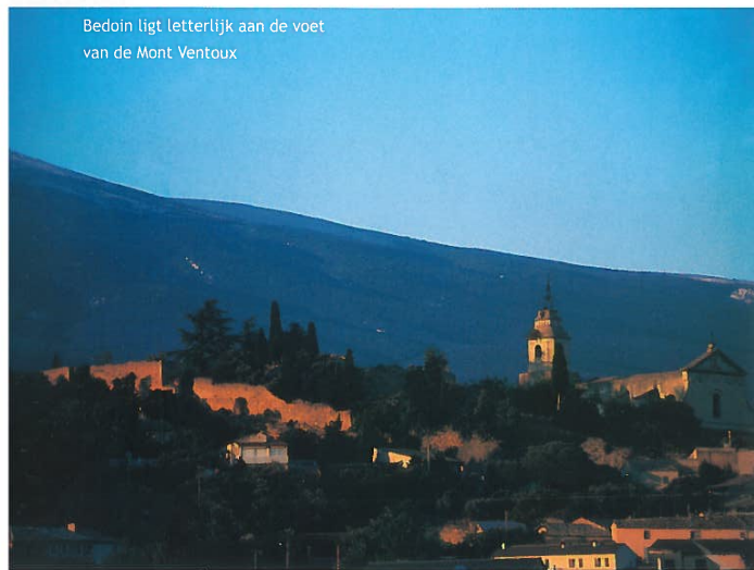
Bedoin ligt letterlijk aan de voet van de Mont Ventoux

In de verte lijkt de top van de Mont Ventoux te reflecteren in het ochtendlicht